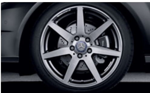
Die AMG Leichtmetallräder im 7-Speichen Bicolor-Design mit Bereifung 225/40 R 18 vorne und 255/35 R 18 hinten.