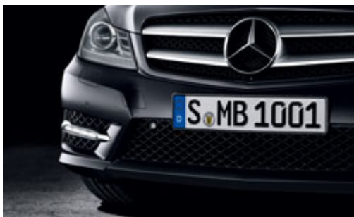
Die sportliche Frontschürze ist Teil des AMG Sport-Pakets.

Die in diesem Prospekt genannten Fahrzeuge weisen folgenden Kraftstoffverbrauch (kombiniert) von 4,4–7,3 l/100 km und CO 2 -Emissionen (kombiniert) von 117–169 g/km auf. Die Angaben beziehen sich nicht auf ein einzelnes Fahrzeug und sind nicht Bestandteil des Angebots, sondern dienen allein Vergleichszwecken zwischen verschiedenen Fahrzeugtypen. Weitere technische Daten entnehmen Sie bitte der ausführlichen Preisliste des C-Klasse Coupés, die Sie von Ihrem Mercedes-Benz Partner erhalten.