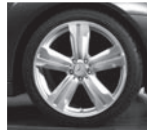
20" Kiyali, 5-Speichen-Design