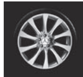
20" Alaraph, 10-Speichen-Design