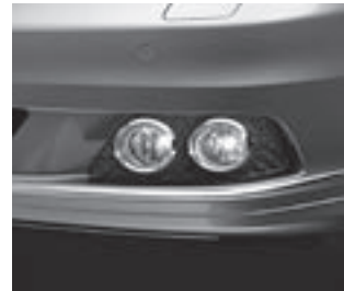
Tagfahrlicht und Nebelscheinwerfer