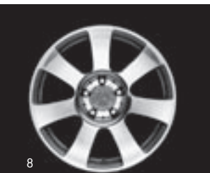
7-Speichen-Design 17" (R44)