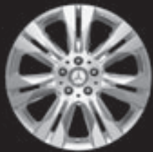
7-Doppelsp.-Design 18" (24R/23R)