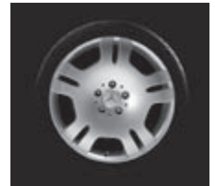
18" Eridanus, 5-Doppelspeichen-Design