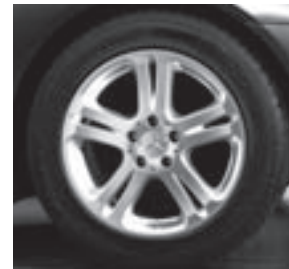
17" Almach, 5-Doppelspeichen-Design