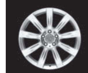
9-Speichen-Design 18" (R91/R92)