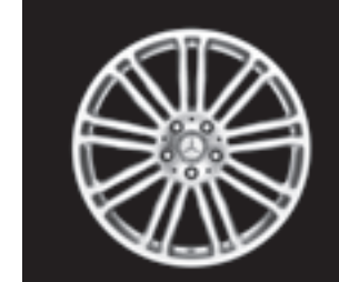
9-Doppelsp.-Design 19" (R85/R94)