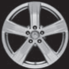
5-Speichen-Design 18" (R96)