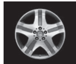
18" V12-Speichen-Design (22R)