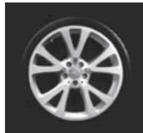
19" Nuklida, 5-Y-Speichen-Design