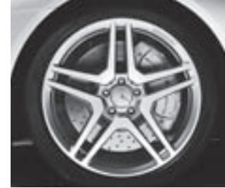
AMG Schmiederad 20" (783)

* tagesaktuelle Konditionen unter www.mercedes-benz-bank.de (siehe Hinweis auf Seite 4)