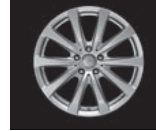
10-Speichen-Design 18" (R71/R41)