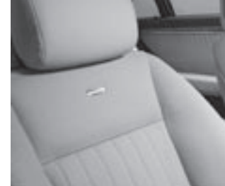
Sitz im V12-Pfeifen-Design

Media Interface: universelle Schnittstelle im Handschuhfach inkl. Kabel (für iPod, USB und Aux) für diverse mobile Audio-Geräte